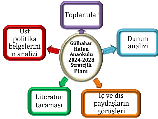
Şekil 1: Stratejik Plan Oluşum Şeması

Gülbahar Hatun Anaokulu için hazırlanmış olan stratejik planlamanın amacına ulaşabilmesi için kurumun tüm çalışanlarının planı sahiplenmesi gerekmektedir. Özellikle okul idaresinin desteği ve katılımı, stratejik planlamanın vazgeçilmez koşuludur. Bu nedenle Okul müdürümüz ile bir araya gelerek konunun önemi üzerinde durulmuştur. Ayrıca kurumda çalışanların, planı sahiplenebilmesi için plan hazırlığının her aşamasında okulun tüm çalışanları aktif rol almışlardır.